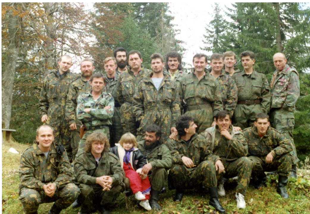
Разведывательно-диверсионный отряд «Белые волки» Сараевско-Романийского корпуса ВРС. Яхорина, 1994 г.