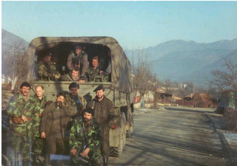
Русские добровольцы Вишеградской бригады, 1992 г.

Ниже – несколько фотографий с войны в Югославии, представленных О.В. Валецким.