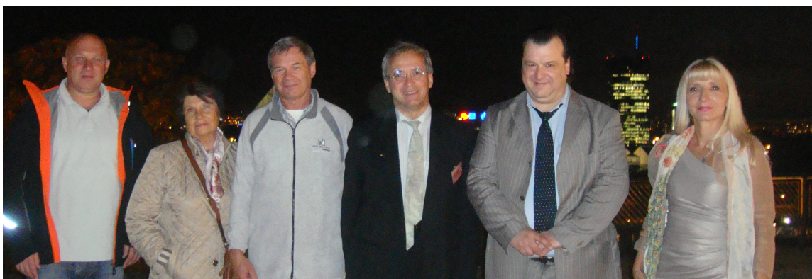
Участники конференции на фоне ночного Белграда