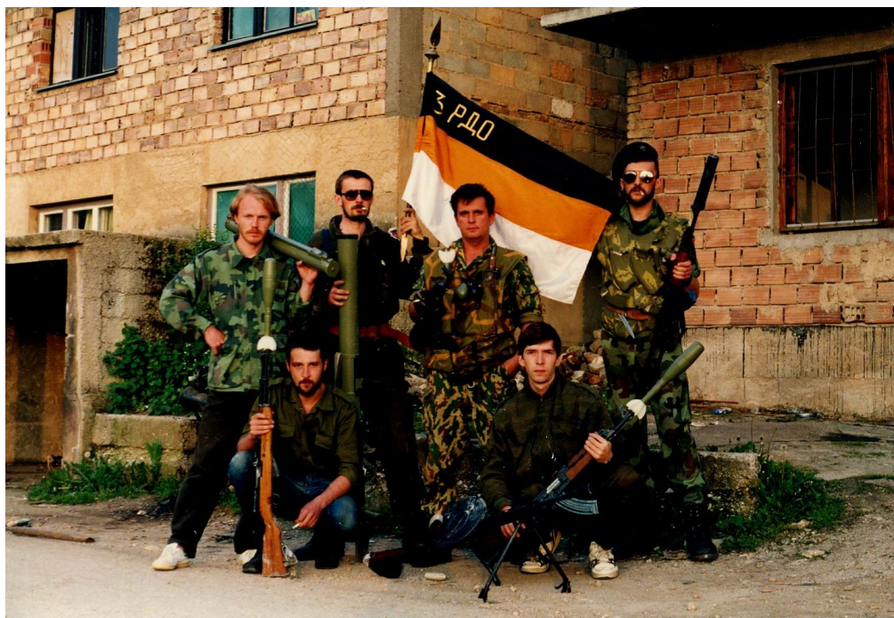
Русские добровольцы 3-го пб 1-й Сараевской бригады ВРС. Сараево, 1994 г.