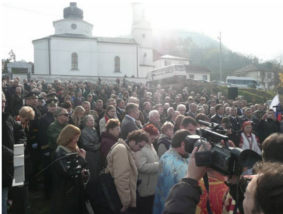
Следующие три фото – освящение памятника Русским добровольцам в Вишеграде в 2011 году