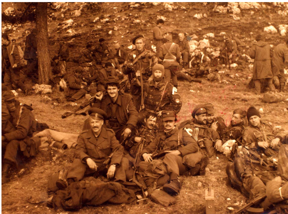
Русские добровольцы и сербские солдаты Горажданской бригады Дринского корпуса ВРС под Горажде. 1993 г.