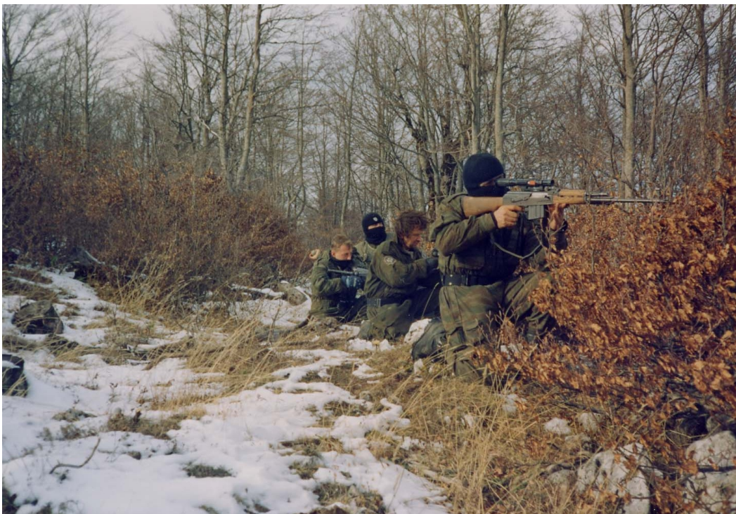
Русские и сербские солдаты. Игман, 1994 г.