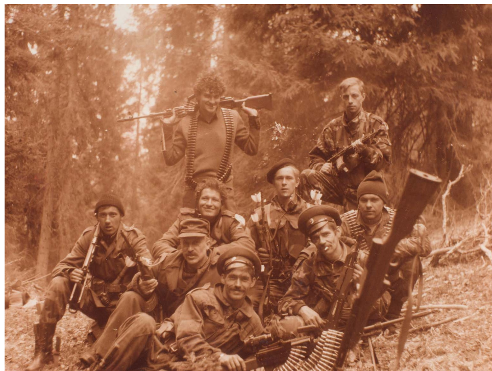
Русские добровольцы Горажданской бригады Дринского корпуса ВРС под Горажде. 1993 г.