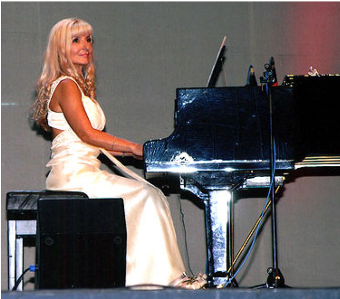
Даца (Даша) Паунович, знаменитая в Сербии концертная пианистка, на своей основной работе.

Но сперва нас ждал сербский хлеб и сербская соль. Какой это всё-таки замечательный славянский обычай! Вкушаешь небольшой кусочек местного хлеба и по его вкусу сразу же понимаешь, каковы местные мастера. Сербы оказались превосходными пекарями! Они же оказались и превосходными танцорами. Зажигательные удары большого барабана,