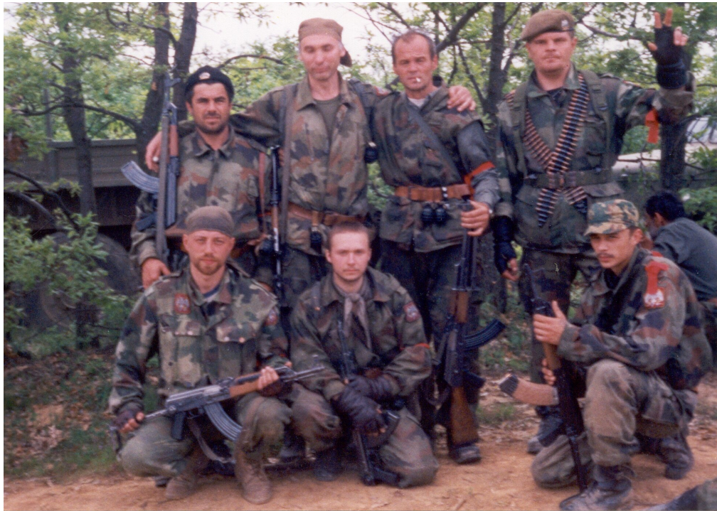
Русские и сербские добровольцы в Косово. 1999 г.