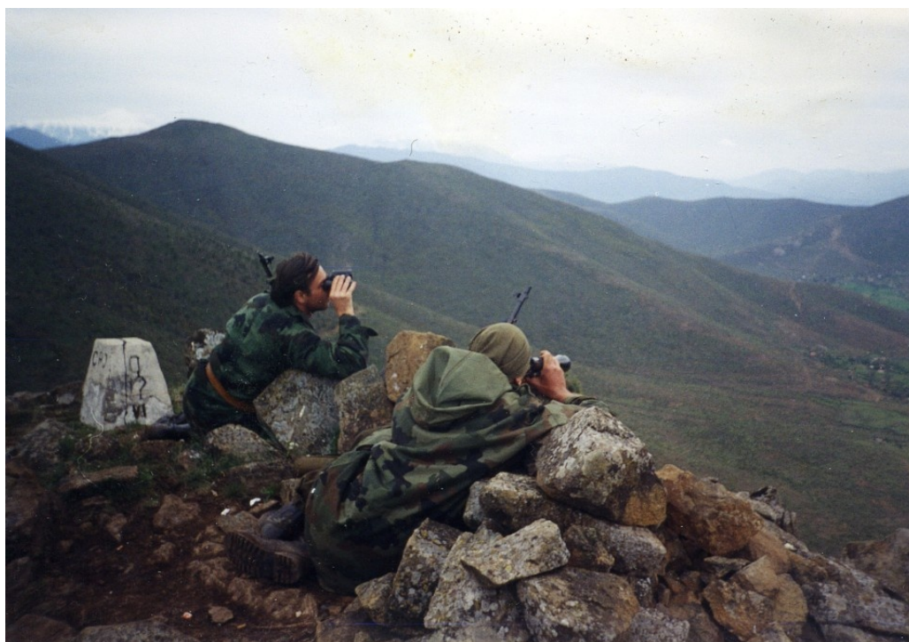
Русские добровольцы ЮА на границе с Албанией. Косово, 1999 г.